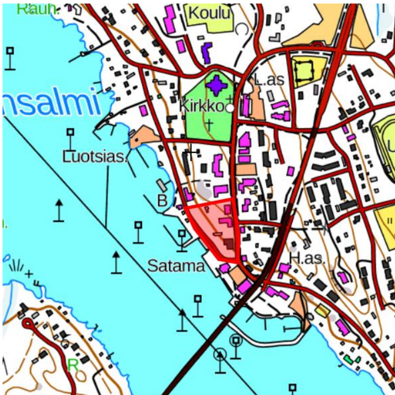
Alustava aluerajaus punaisella

Asemakaavan muutoksen tarkoituksena on päivittää alueen tonttien rakennusoikeus ja kerroskorkeus. Muutoksen taustalla on maanomistajan halu kiinteistön kehittämiseksi. Alueelle on tehty aiemmin ELY-keskuksen 30.6.2015 antama poikkeamislupapäätös (ESAELY/718/2015) kiinteistölle 623-414-12-22 (tontti nro 1). Muutoksessa tarkastellaan myös Satamatien katualueen rajautuminen korttelin etelä/länsi/lounaisosassa.